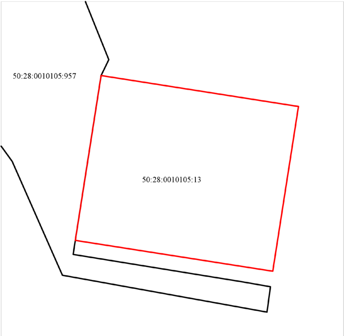
Схема расположения земельного участка в окружении смежно расположенных земельных участков (Ситуационный план)